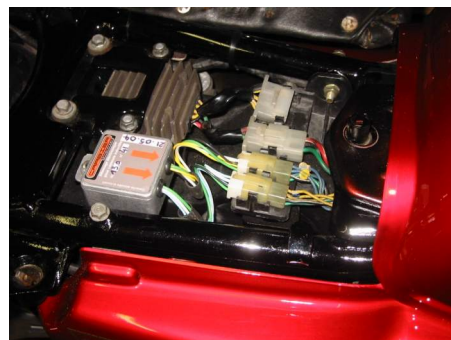
Le module en place sur une CB650. The ignition module in place on a Honda CB650